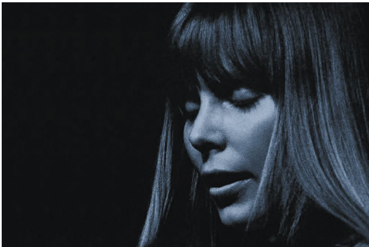
O mítico Blue foi o 4.º álbum da cantautora canadiana.