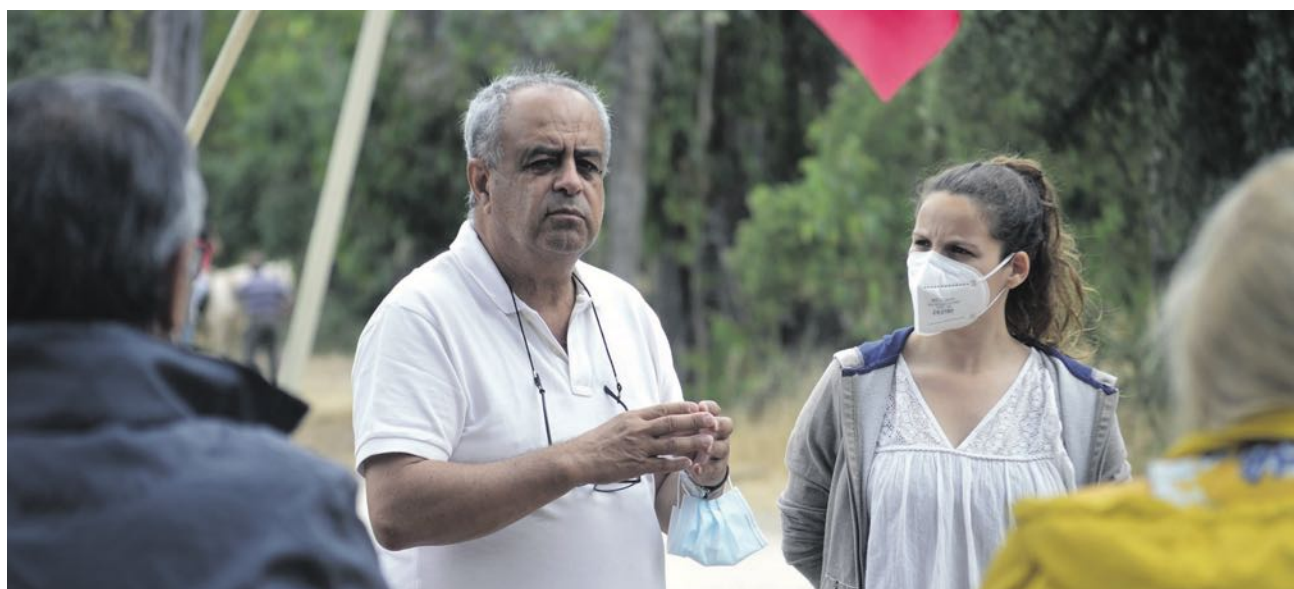
O candidato é atualmente primeiro secretário da comissão executiva da AML