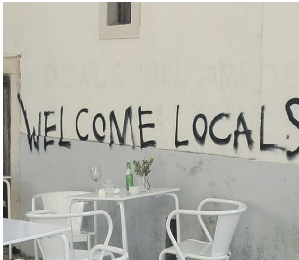
“Bem-vindos moradores locais”, lê-se num grafiti em Alfama.

Segundo Alexandre Abreu, é um setor que “tem sido bom” sobretudo no contexto da crise para gerar muito emprego mas é um emprego “tendencialmente de baixos salários, baixa produtividade, com pouca margem de progressão”. Considera que é “melhor do que estar afundado na