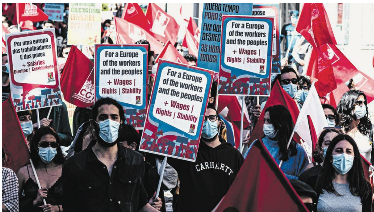
Central sindical quer “intensificar a ação reivindicativa e a luta nas empresas, locais de trabalho e serviços”.

A central sindical convocou uma ação de luta nacional e inter-sectorial, que decorrerá até ao próximo dia 15 de julho. “De acordo com as decisões do Conselho Nacional e do Plenário de Sindicatos, a CGTP-IN decidiu intensificar a ação reivindicativa e a luta nas empresas, locais de trabalho e serviços, realizando uma jornada de ação de luta que terá início no dia 21 de junho e durará até 15 de julho”, indicou, em comunicado, a intersindical.