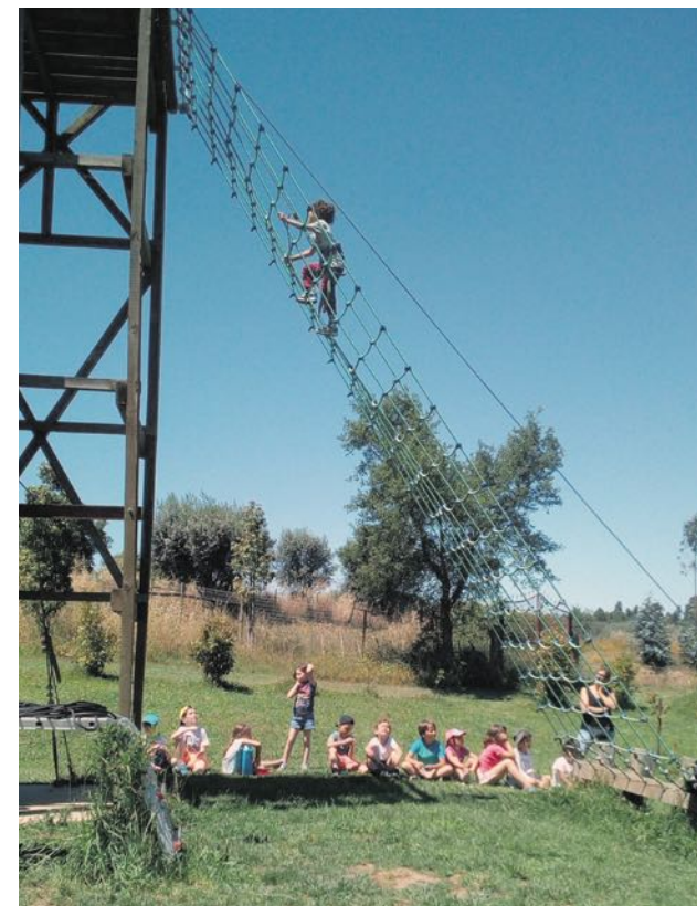
As atividades são todas cuidadosamente escolhidas.