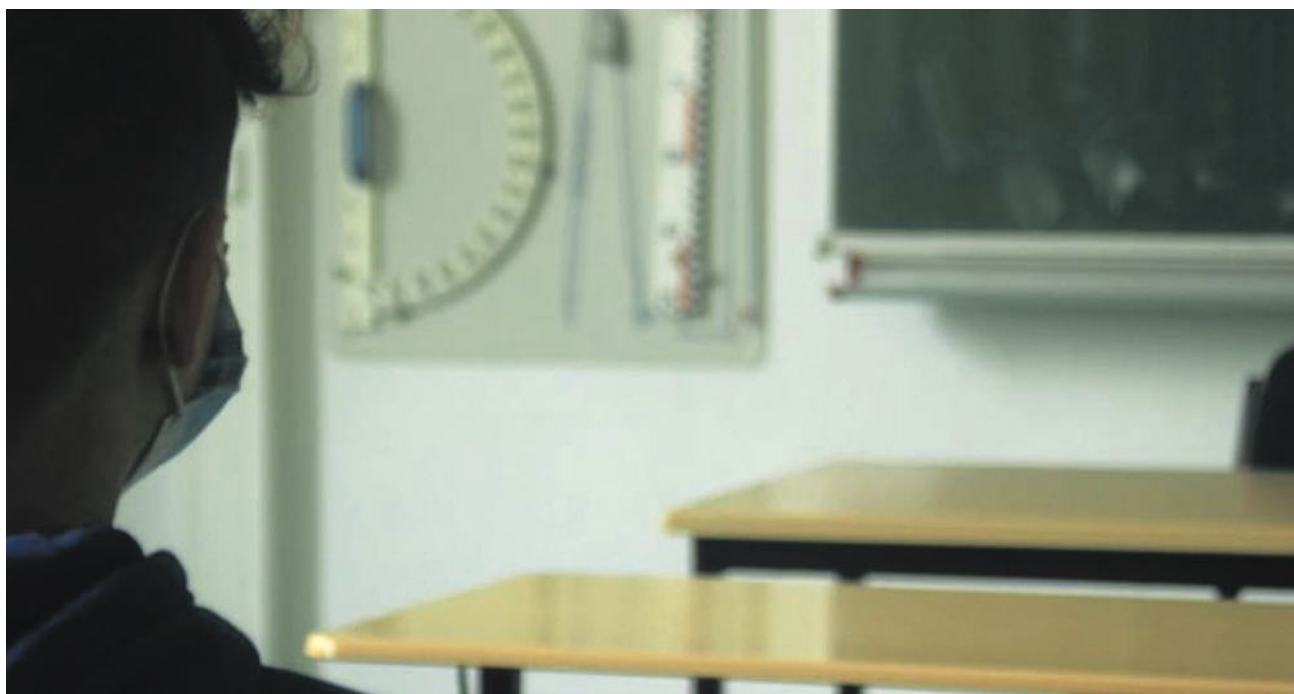
A transição para o ensino à distância gerou stress e cansaço.