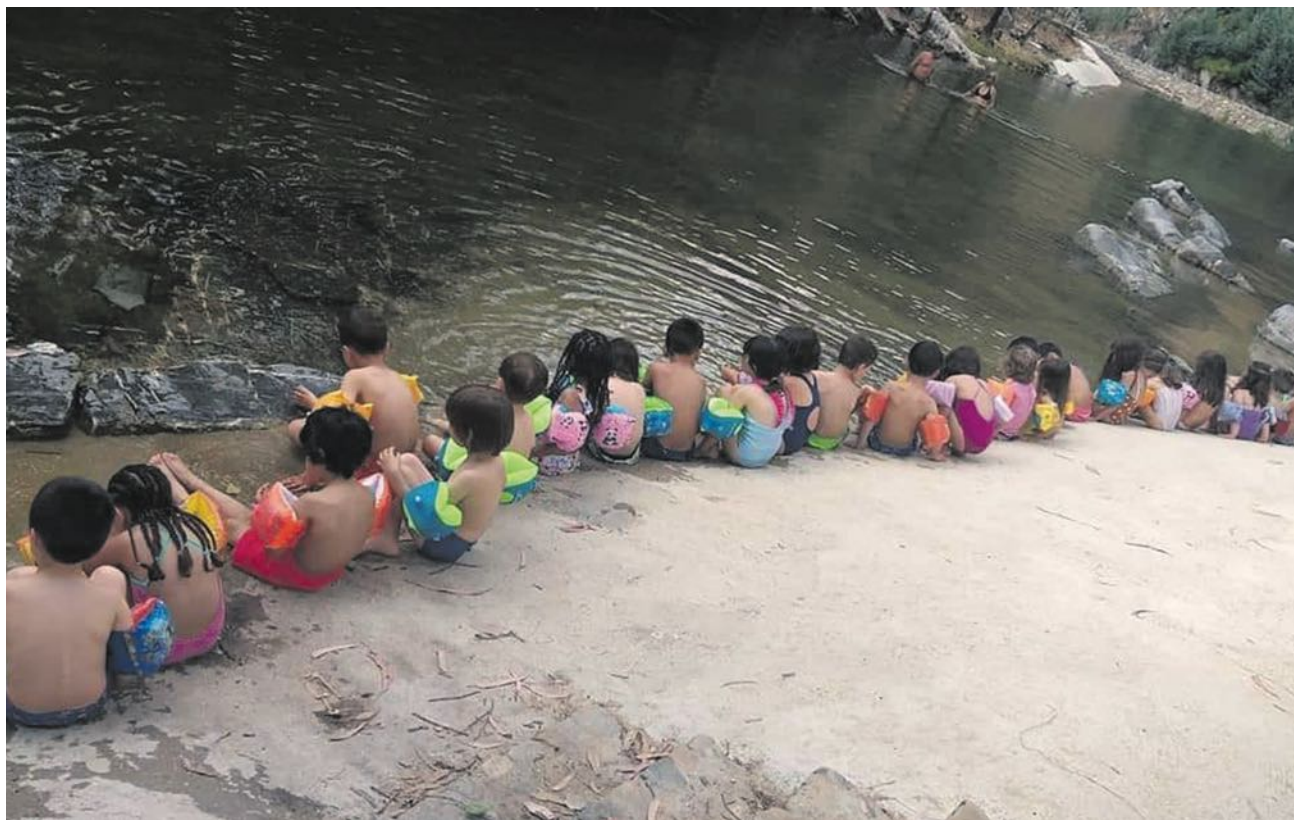
“O poder pedagógico desta atividade dá mais valor ao que queremos fazer dentro das nossas salas de aula.”