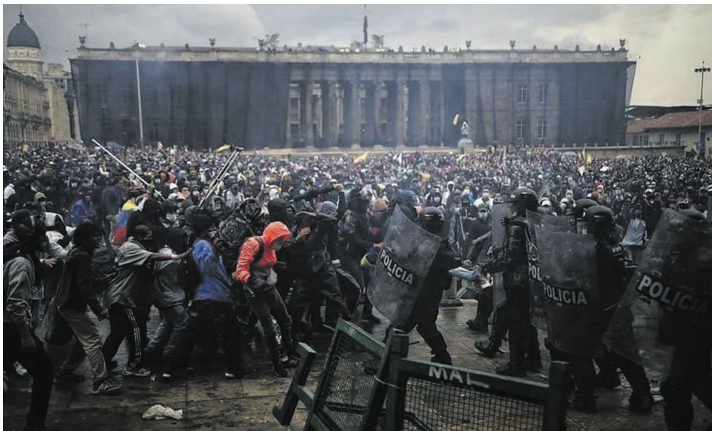
Os confrontos agudizam-se em vários países da América Latina.