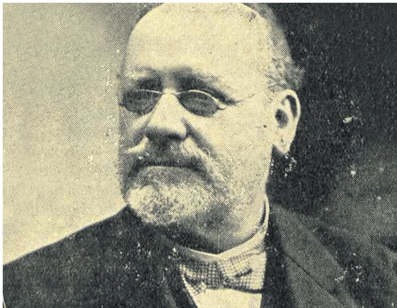
Azedo Gneco [Almanaque Socialista para 1931].