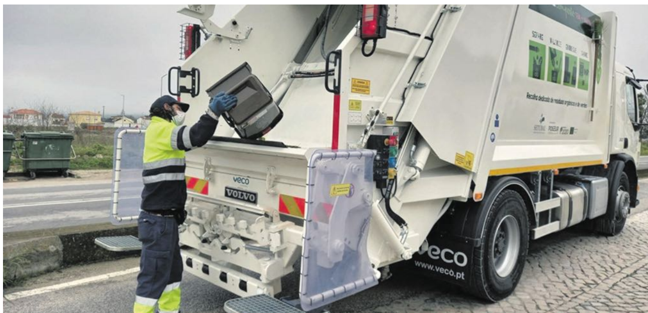
Autarquia recolhe resíduos resultantes da limpeza de jardins e resíduos orgânicos, resultantes da preparação de refeições.